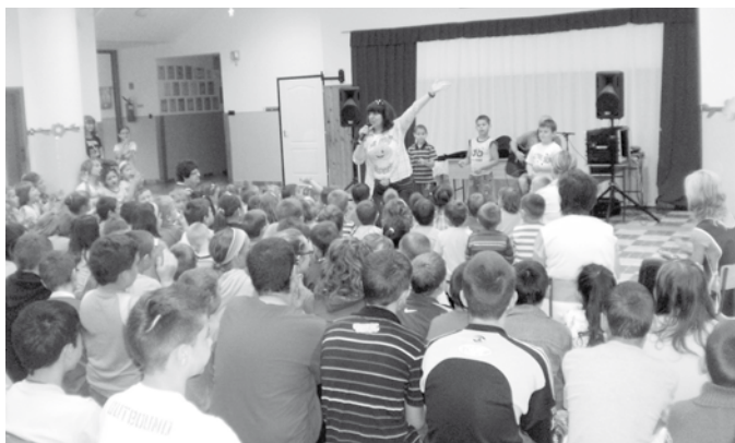
A Romwalter duo fellépése