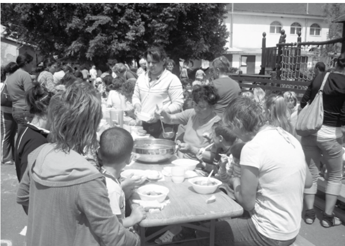
Gyermeknap az óvodában