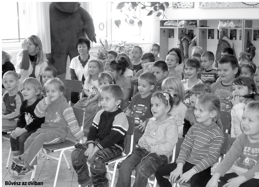
Bűvész az óviban

Az óvoda nevelőközösége szeretettel várja az új jelentkezőket!