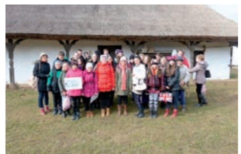
Az anarcsi bálványos ház előtt