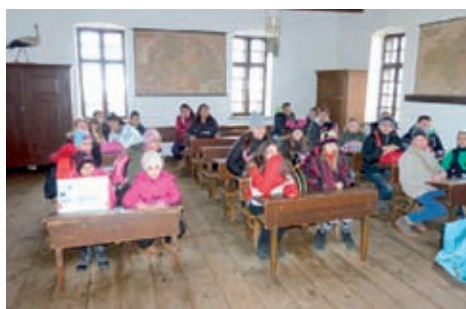
Falumúzeum - a régi iskolában