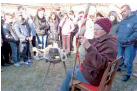
Beregdaróc - tájház