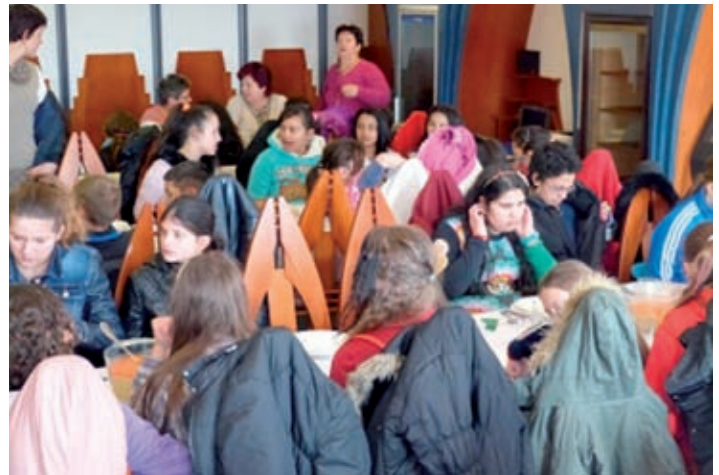
Közös ebéd Beregdarócon