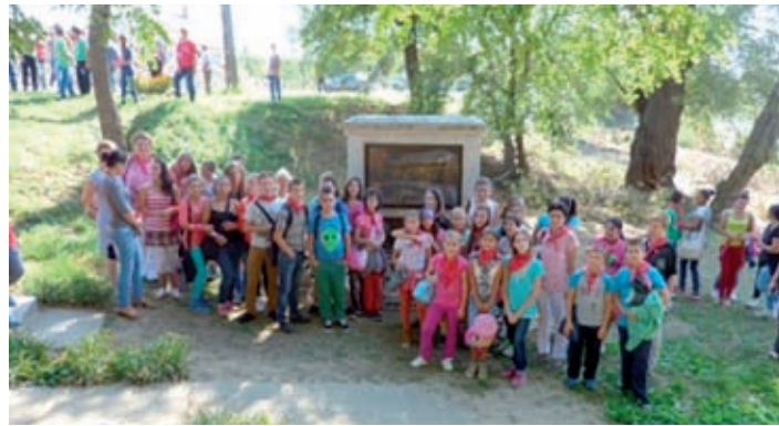
Tunyogmatolcs – testvériskolai program

Kiemelt figyelmet fordítottunk az egészséges életmódra, mely témában az előadás mellett gyümölcskosztolóval örvendeztettük meg a diákokat. A generációk együttélése előadást a diákok időseknek rendezett műsora színesítette. Környezetvédelmi vetélkedőn dolgozták