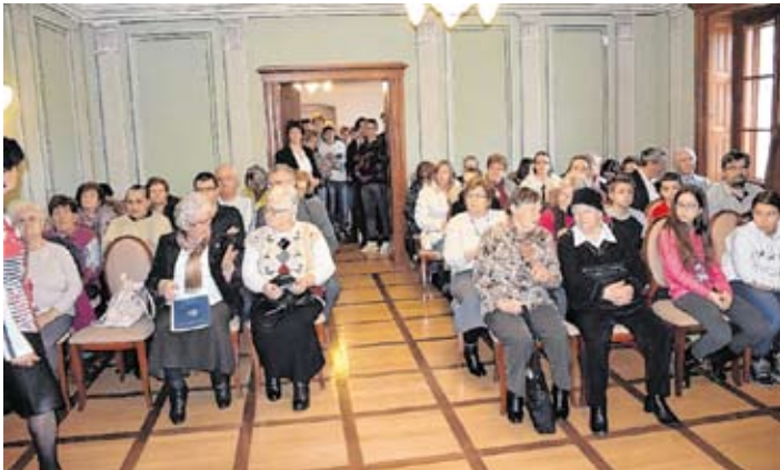
Béres 100 ünnepség