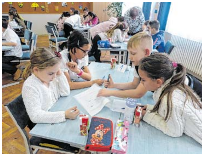
Czöbel Diáknapok, alsós vetélkedő