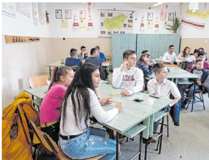
Czöbel Diáknapok, felsős vetélkedő