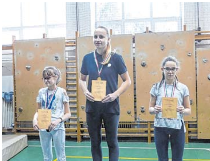
Ninja Warrior győztesei

mazkodunk a kialakult helyzet-hez. Szülőnek, diáknak, tanárnak nagy kihívás, hogy minden nap a tananyag megérkezzen a tanulókhöz, ők pedig tanuljanak, majd a kapott feladatot visszaküldjék. Nevelőink minden lehetséges IKT-felületet