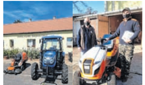
MAGYAR FALU PROGRAM Eszközfejlesztés belterületi közterületek karbantartása című pályázat