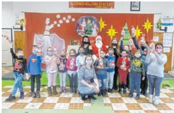
Az 1. osztályosoknak a Mikulás hozott csomagot