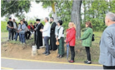
Régi szokás, új köntösben falu- és termőföldek megszentelése