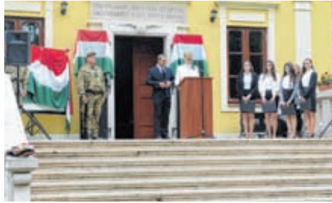
Trianon 100. évfordulójára rendezett megemlékezésünk