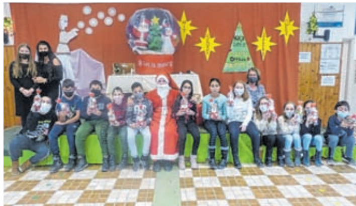
A 4. osztályosoknak is hozott csomagot a Mikulás