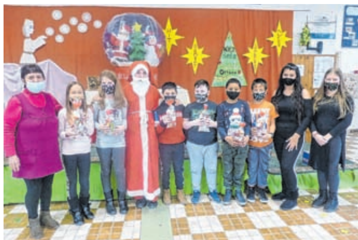
A 3. osztályosokkal is találkozott a Mikulás