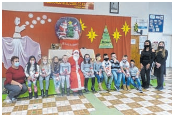
A 2. osztályosok és a Mikulás