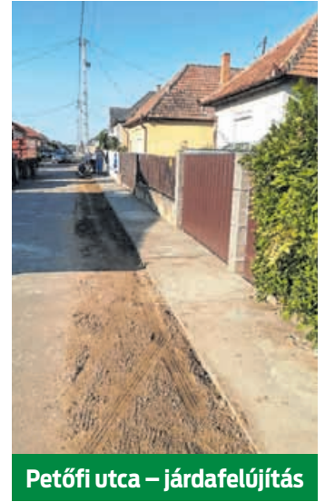
Petőfi utca – járdafelújítás