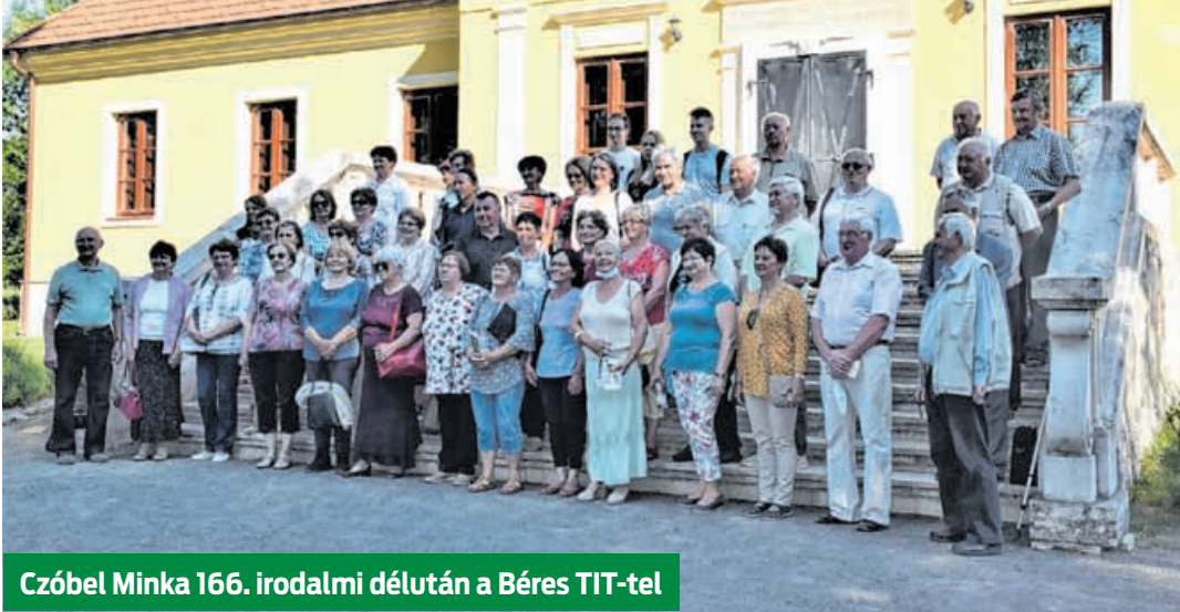
Czóbel Minka 166. irodalmi délután a Béres TIT-tel