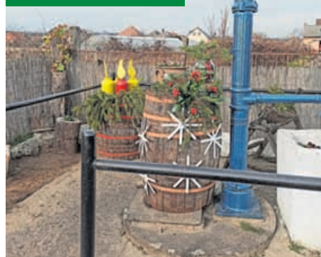
Karácsonyi díszítés a kutaknál