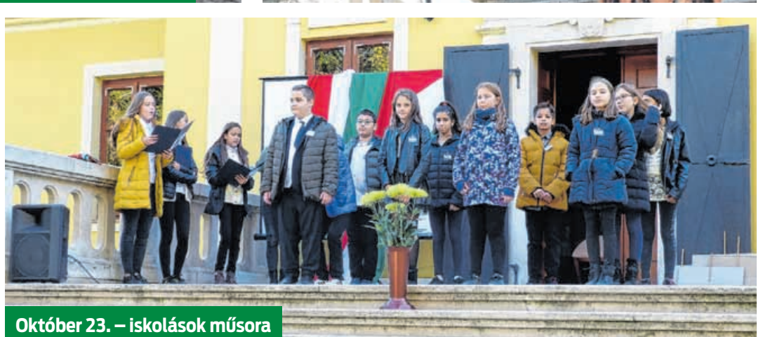
Október 23. – iskolások műsora