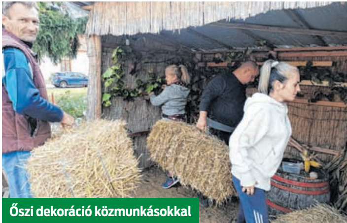
Őszi dekoráció közmunkásokkal